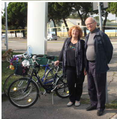
Grandi e piccoli artisti al lavoro nel corso della manifestazione.

Scorcio del murales che è stato dipinto sul muro di cinta dei Mercati Ittico e Floricolo.