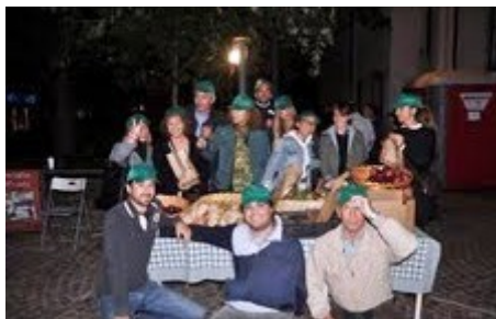
Foto di gruppo dei grossisti che in prima persona si sono fatti carico della distribuzione della frutta in occasione dell'edizione 2012 della manifestazione benefica.

Il prossimo 19 ottobre 2013 si terrà a Milano la 14ª edizione de "LA NOTTE DEI SENZA DIMORA": una iniziativa rivolta ai più bisognosi che dalle 18.30 fino alle