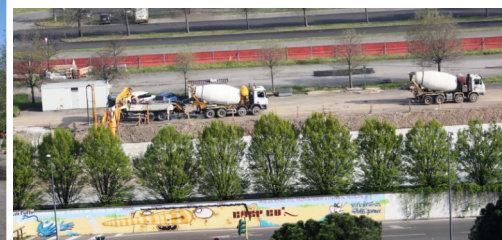
Foto sotto e a lato: lavori in corso per la costruzione della piattaforma ambulanti del nuovo Mercato Avicunicolo.