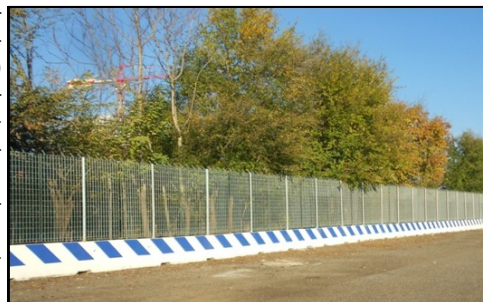
Nuova palizzata anti-intrusione del Mercato Ortofrutticolo (lato Ferrovia) : nuova recinzione "mobile" in new jersey (altezza 0,80 m) e pannello grigliato (altezza 2,10 m)