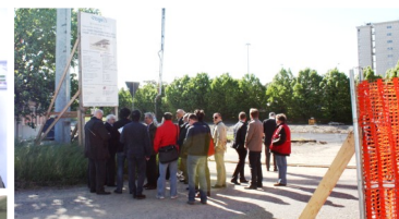
Alcuni momenti del sopralluogo dei Consiglieri comunali (incontro in sala riunioni, visita al mercato Floricolo e al cantiere del nuovo Mercato Avicunicolo).