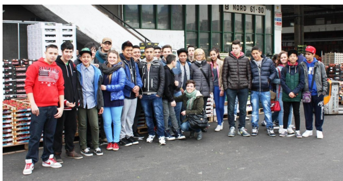
Foto di gruppo degli studenti del corso di ristorazione del CFP Galdus con i loro docenti di cucina che hanno visitato il Mercato Ortofrutticolo in data 26 marzo 2014 e 1° aprile 2014.