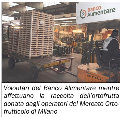
Volontari del Banco Alimentare mentre affettano la raccolta dell'ortofrutta donata dagli operatori del Mercato Ortofrutticolo di Milano

"Il progetto sulle 'Best Sustainable Development Practices' - ha dichiarato il Ministro Martina - tocca il cuore del grande tema espositivo