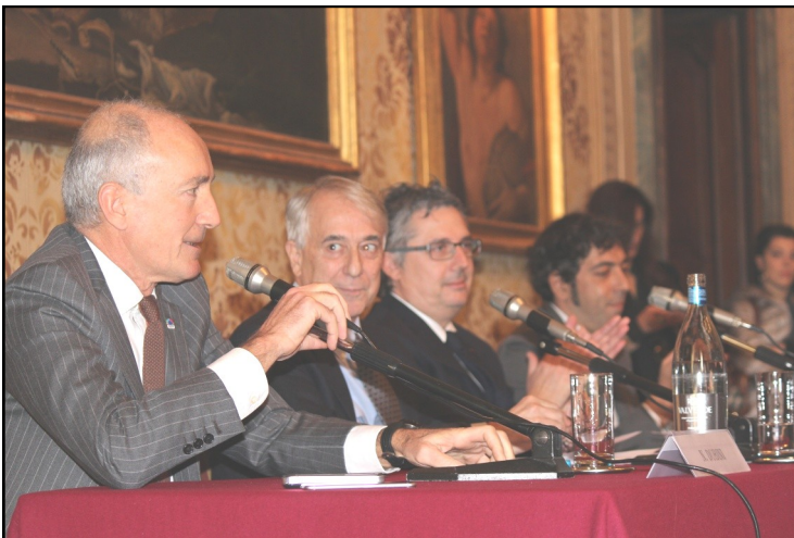
4 marzo 2015 - Palazzo Marino - Conferenza stampa di presentazione di Estathé Market Sound.

Ciò dimostra, una volta di più, quanta energia Milano è capace di dare. Expo in Città, all'interno di cui è organizzato Estathé Market Sound, non finisce di stupire per il numero e la qualità di eventi che Milano saprà offrire ai cittadini e ai milioni di turisti che arriveranno per l'Esposizione Universale.