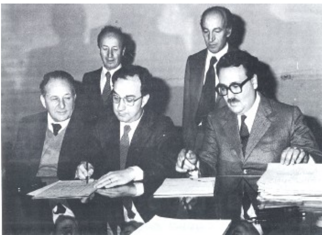
27 maggio 1980 - Il Sindaco di Milano Carlo Tognoli e il Presidente di Sogemi dott. Luigi Carnevale, firmano l'atto di convenzione con la quale veniva affidata alla Società anche la gestione degli altri mercati all'ingrosso cittadini in aggiunta a quello ortofrutticolo

Attualmente, chiusi il Mercato all'ingrosso delle Carni e il Pubblico Macello, fanno capo a Sogemi i Mercati: Ortofrutticolo, Ittico, Floricolo e Avicunicolo. I mercati all'Ingrosso di Sogemi costituiscono una delle maggiori realtà a livello europeo per il commercio all'ingrosso dei prodotti agroalimentari freschi.