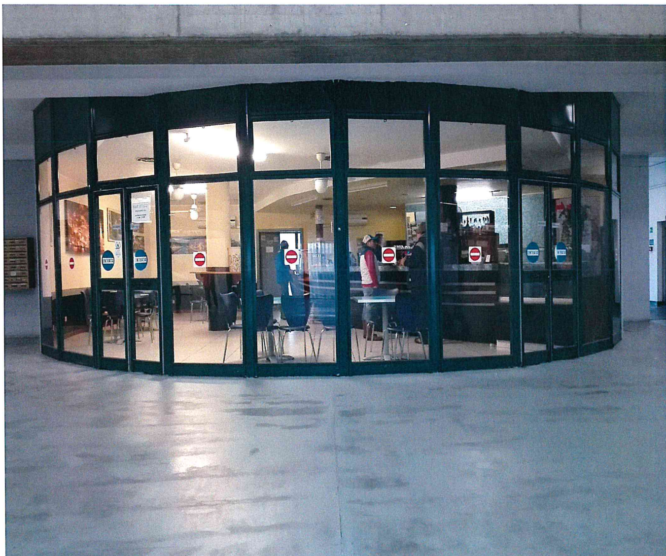
FOTO ESTERNO LOCALE

Unità immobiliare MI/33 : Foglio 443 – Mappale 317 – Sub. 703 - categoria C1 - R.C. 5.599,22