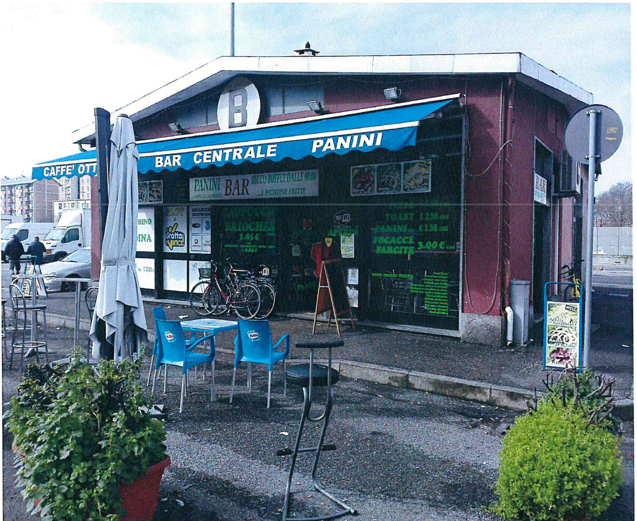
FOTO ESTERNO LOCALE

Unità immobiliare MO : Foglio 486 – Mappale 26 – Sub. 702 - categoria C1 - R.C. 4.164,71