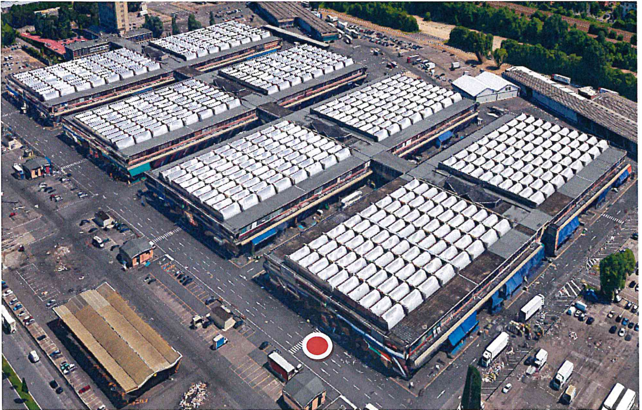
FOTO ESTERNA UNITA'