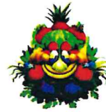
Foto Padiglione Mercato fiori