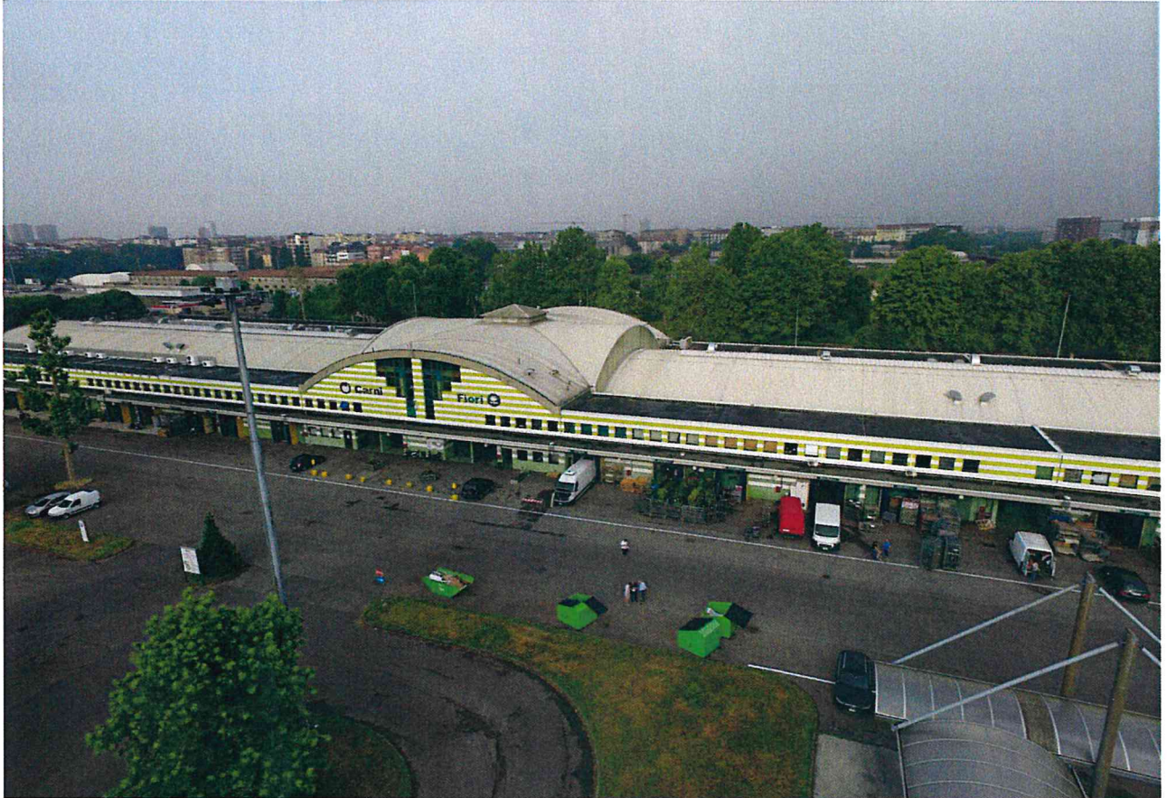
Foto esterna unità