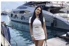
Getting Rich With Bitcoin, Without Even Buying Bitcoin