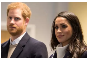
More Sad News For Meghan Markle And Prince Harry