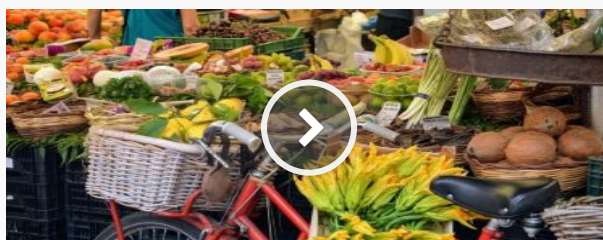
Covid: Cia rilancia consegne cibo fresco e sano a domicilio