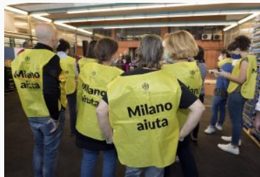
Al mercato di Milano sempre forte l'attenzione per l'aiuto solidale

Una notizia positiva in questo contesto negativo di calo dei consumi è il recupero del prodotto . La frutta e verdura invenduta non è stata smaltita come rifiuto, anche questo un costo, ma consumata dall'esercito delle persone in difficoltà.