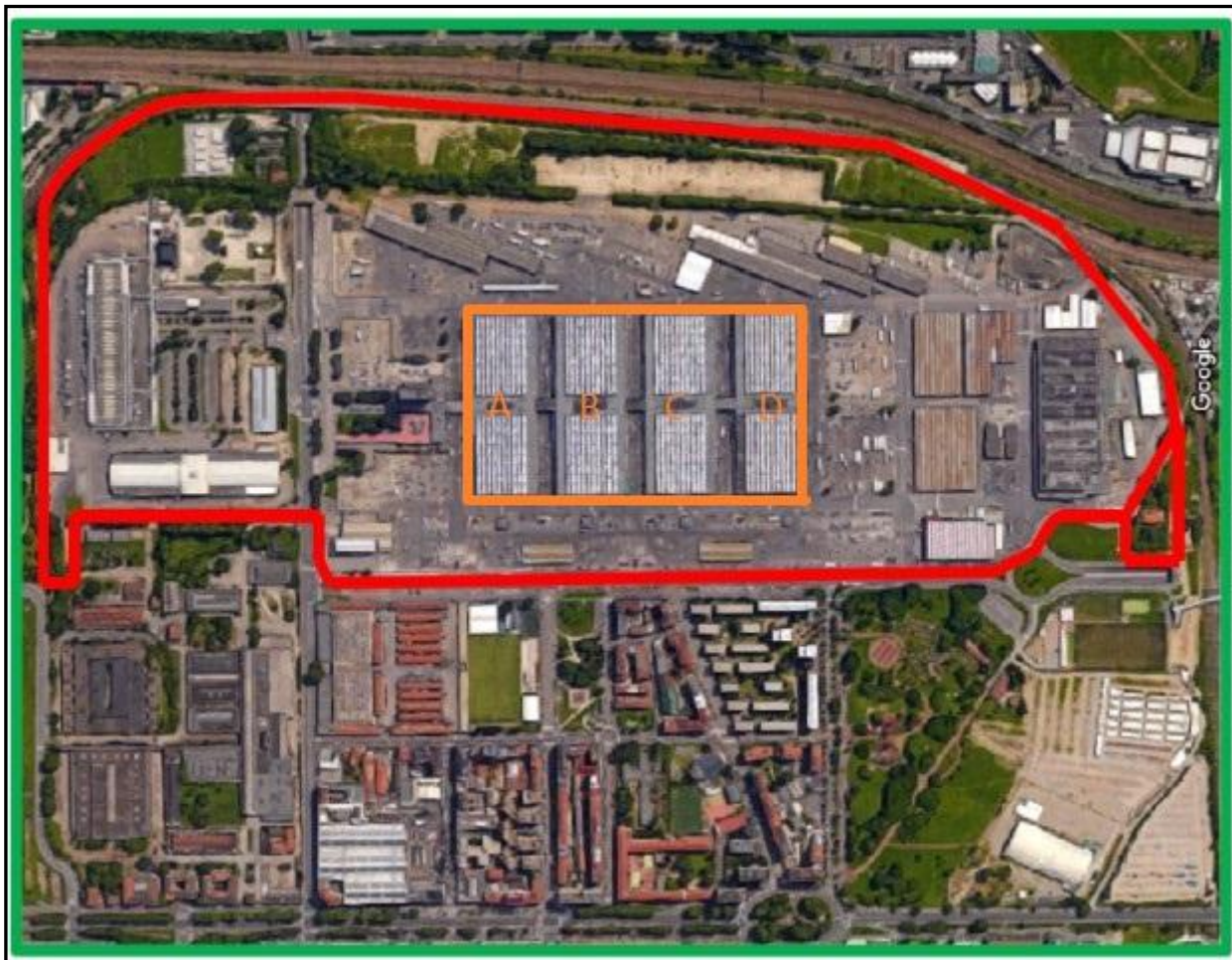
Fig. 1 – Individuazione padiglioni

I padiglioni oggetto dell'appalto sono ubicati all'interno del Mercato Ortofrutticolo, nel Comune di Milano, nel Comprensorio Agroalimentare di Via C. Lombroso, 54.