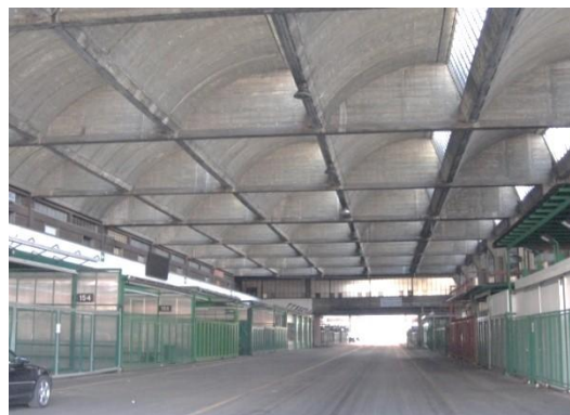
Fig. 3 – Vista paglione A - interno