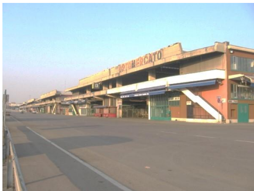
Fig. 2 – Vista paglione A - esterno