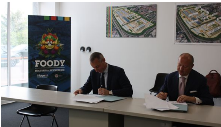
L'accordo prevede la realizzazione di una centrale di raffreddamento per i sistemi di refrigerazione dei nuovi padiglioni e di tre impianti fotovoltaici per la produzione di 2400 MWh annuali