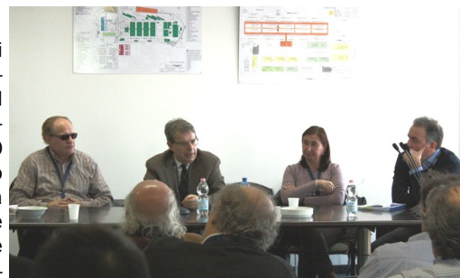
Foto sopra: L'Assessore al Commercio, Attività produttive, Turismo e Marketing territoriale del Comune di Milano, Franco D'Alfonso, incontra i lavoratori della Società (nella foto con i rappresentanti sindacali della RSU Sogemi).

Foto in alto: L'Assessore (con a fianco i Consiglieri AGO) illustra agli operatori le strategie e i passaggi che porteranno alla riqualificazione dei mercati.