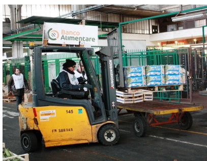
Foto in alto: I volontari del Banco Alimentare mentre raccolgono i prodotti dati loro in beneficenza dai grossisti.

raccolta del cibo presso il mercato e fornire loro le informazioni necessarie per metterli nelle condizioni di poter eventualmente replicare questa importante esperienza nei rispettivi Paesi di provenienza al fine di migliorare il mix alimentare dei loro assistiti grazie all'aggiunta di frutta e verdura fresca.