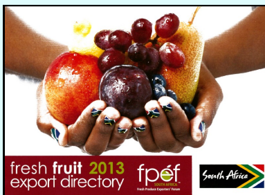
Nella foto: Il Catalogo riportante l'elenco delle società sudafricane esportatrici di ortofrutta.