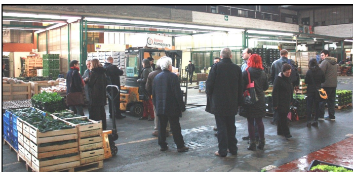
Immagine di una vecchia campagna Sogemi di sensibilizzazione degli operatori per un mercato più pulito, antesignana in un certo qual modo delle attuali varie iniziative di sensibilizzazione contro lo spreco alimentare.